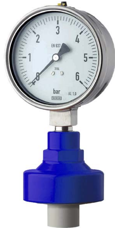
Резьбовое присоединение к процессу, Пластиковая конструкция, Модель 990.31 с манометром 232.50 HP 100