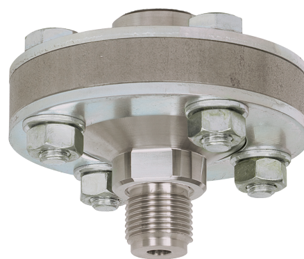
Мембранные разделители с резьбовым присоединением, модель 990.10

„Применение, принцип действия, конструкции“.